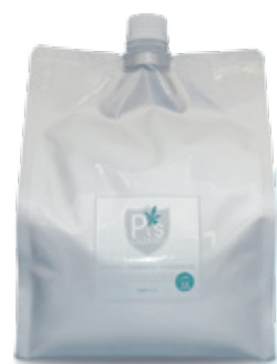
【別売】 詰替専用「ピーズガード」 2.3L (減容容器入) ×4本/箱

ミストになっても失活しないのは、超低濃度でも揮発しにくく、安定しているピーズガードだからこそ。より広く、より遠くまで、効率よく除菌消臭効果を届けます。